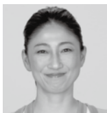
運動指導・監修 健康運動指導士 まえだ あき